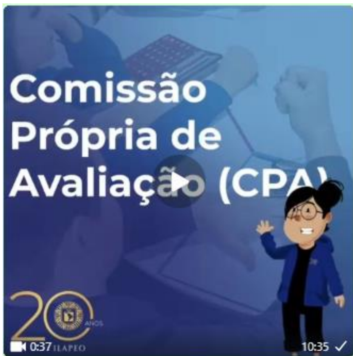
Figura 2 – Capa vídeo O que é CPA - Fonte: Marketing ILAPEO – vídeo divulgação CPA